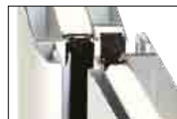
WANDUNGSSTÄRKE BIS 3 MM