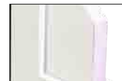
FÜLLUNG 34/44/94 MM

Standardmäßig sorgen drei umlaufende Dichtungsebenen ohne Unterbrechung für eine hohe Wind- und Wetterfestigkeit. Nur eine wirklich dichte Tür schützt Sie vor Kälte und Lärm. Eine GROKE Haustür ist so dicht wie ein Fenster. Lassen Sie sich von den Produkteigenschaften überzeugen!