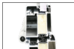
DÄMMZONE MIT ZUSÄTZLICHER ISOLIERUNG